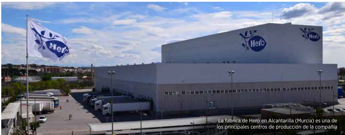
La fábrica de Hero en Alcantarilla (Murcia) es una de los principales centros de producción de la compañía